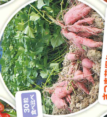
さつま芋狩り 9月上旬～10月下旬 ラベンダー摘み 5月下旬～6月下旬 ブルーベリー狩り 7月 (30分間) とうもろこし狩り 7月 その他