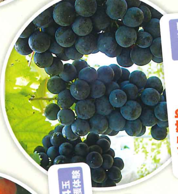
ぶどう狩り 8月6～8月下旬 食べ放題