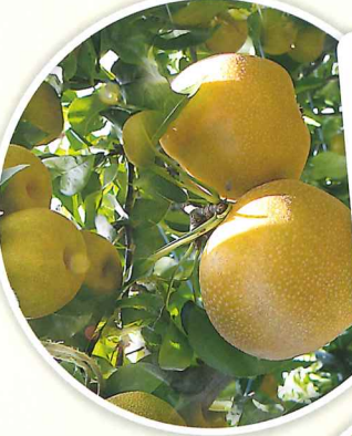
なし狩り 8月中旬～9月下旬 食べ放題