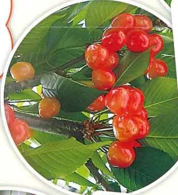
さくらんぼ狩り 6月上旬～6月下旬 30分間 食べ放題 30分間 食べ比べ