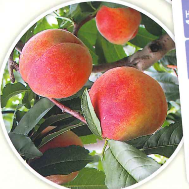
桃狩り 7月上旬～8月上旬 4玉 収穫体験 食べ放題