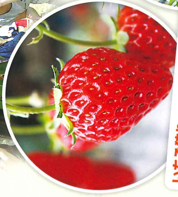
いちご狩り 1月上旬～5月下旬 30分間 食べ放題 45分間 食べ比べ

季節ごとに新鮮な果実や野菜の収穫が楽しめます! (数に限りがあります。収穫物がなくなり次第終了させていただきます。 また、気候により時期が変更になる場合がありますので、予めご了承ください)