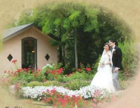
ガーデン ウェディング