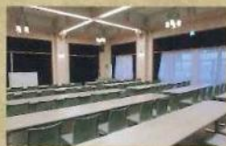
「桃山」セミナースタイル

※ご利用の予約申込はご利用日の4か月前より受付します。 詳細は、びわ湖大津館へお問い合わせください。