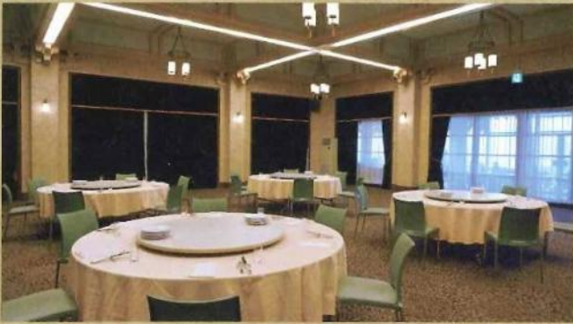
「桃山」宴会スタイル