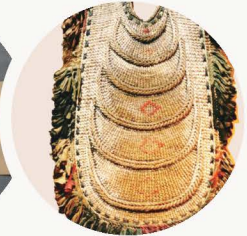
【県指定文化財】 *文化財指定外の資料を常設展示