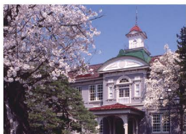
山形県立博物館教育資料館(分館)

昭和51年(1976)に開設された「附属自然学習園」は、県内でもっとも貴重な湿原である琵琶沼(県指定天然記念物)を中心とする「県民の森」の一角に位置し、自然学習の場を提供しています。