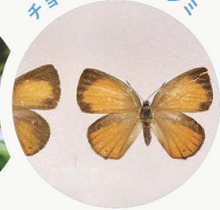
【県指定天然記念物】