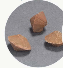
【県指定天然記念物】 (地域指定・小国町)