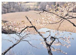
山形県立博物館附属自然学習園(琵琶沼)