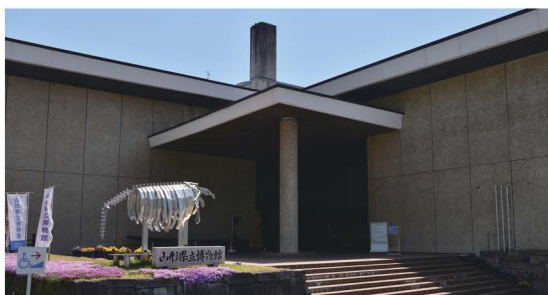
山形県立博物館(本館)

山形県の明治百年記念事業として設立された本館では、県のなりたちから現代にいたる自然と人々の営みとその変遷を、地学・植物・動物・考古・歴史・民俗の各分野をとおして紹介しています。