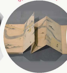
【県指定文化財】 *レプリカを常設展示